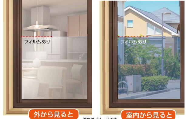
写真はイメージです ※上記のような見え方は屋外側が明るく室内側が暗い場合に限りです。

スリキズ スリキズに強い！ハードコート仕様！ キズがつきにくく、窓拭きなどのお手入れも安心