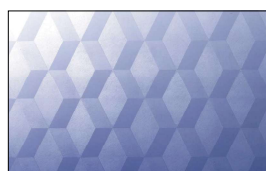
HGLE-07 ダイヤモンドクロス模様