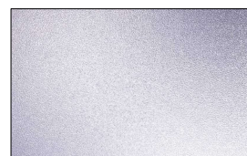
HGLE-16 サンドブラスト模様