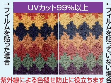
紫外線による色褪せ防止に役立ちます